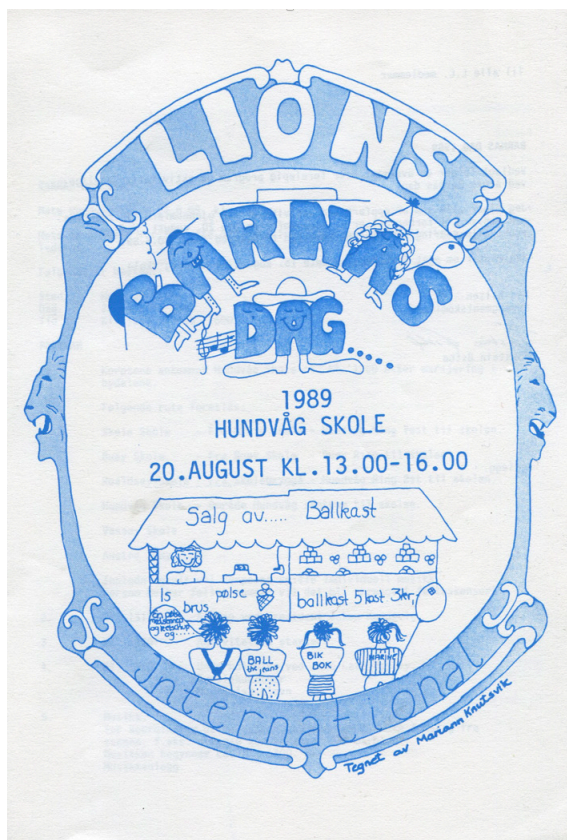
Det første programblad 20.08.1989