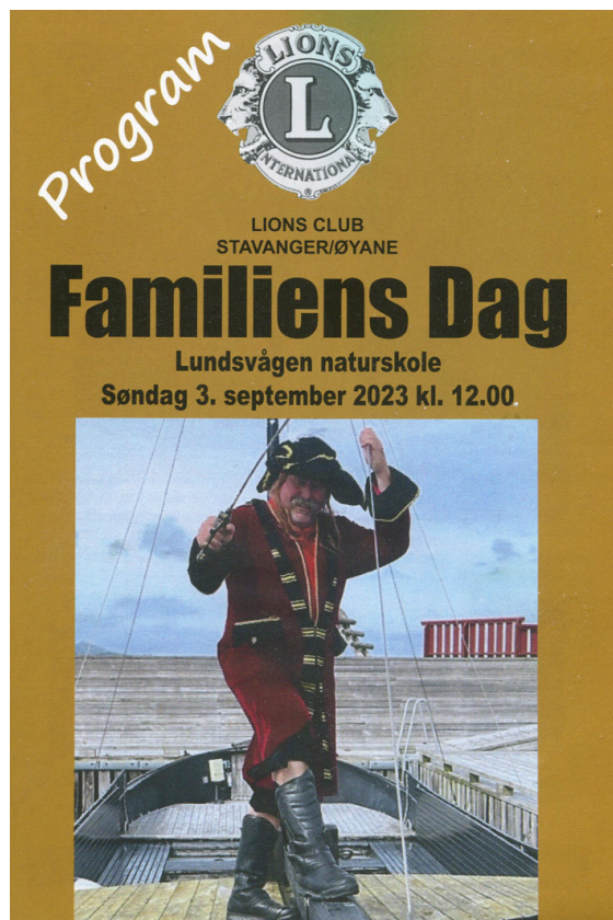
Det siste trykkede programblad 3.9.2023